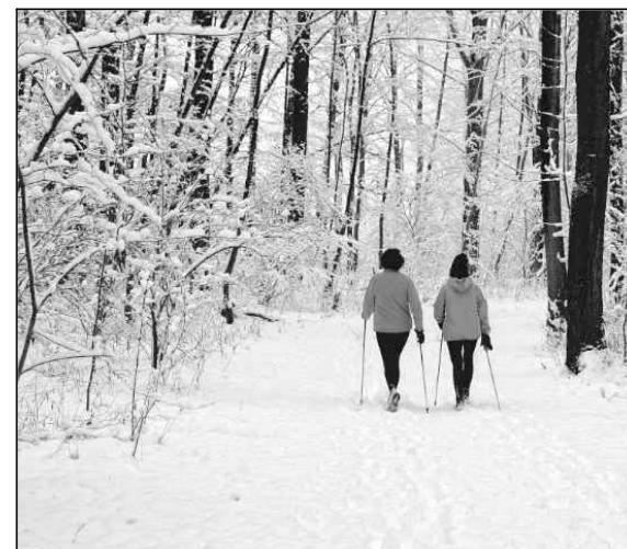
Piemērs: atpūtas iespējas ziemā