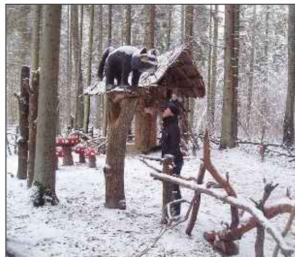
Piemērs: tematiskās takas ziemā