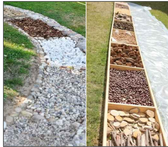
Piemērs: sajūtu (baskāju) takas inventārs

Sajūtu (baskāju) taka piedāvā pastaigas ar basām kājām pa dažāda raupjuma un tekstūras materiāliem: čiekuriem, oļiem, skaidām, smiltīm utt.