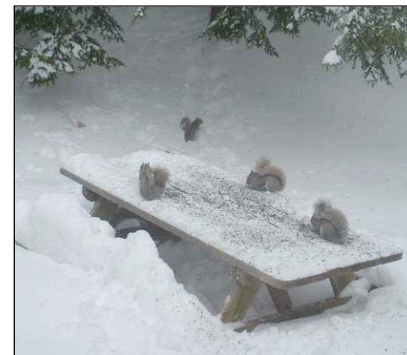
Piemērs: atpūtas iespējas ziemā