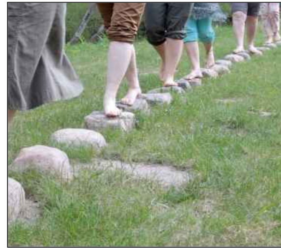
Piemērs: sajūtu (baskāju) takas inventārs