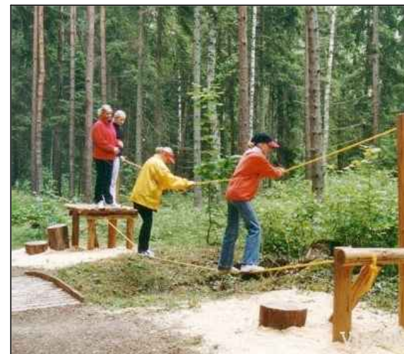
Piemērs: sporta takas inventārs Laumu dabas parkā