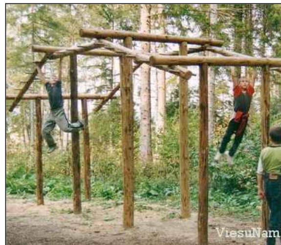
Piemērs: sporta takas inventārs Laumu dabas parkā

Atsevišķās vietās ierīkotas atpūtas vietas piknikam, kurās uzstādīti koka galdiņi un soliņi. Parka koncepts pieļauj ūdens virsmas izmantošanu, pārvietojoties ar nemotorizētiem ūdens transportlīdzekļiem.